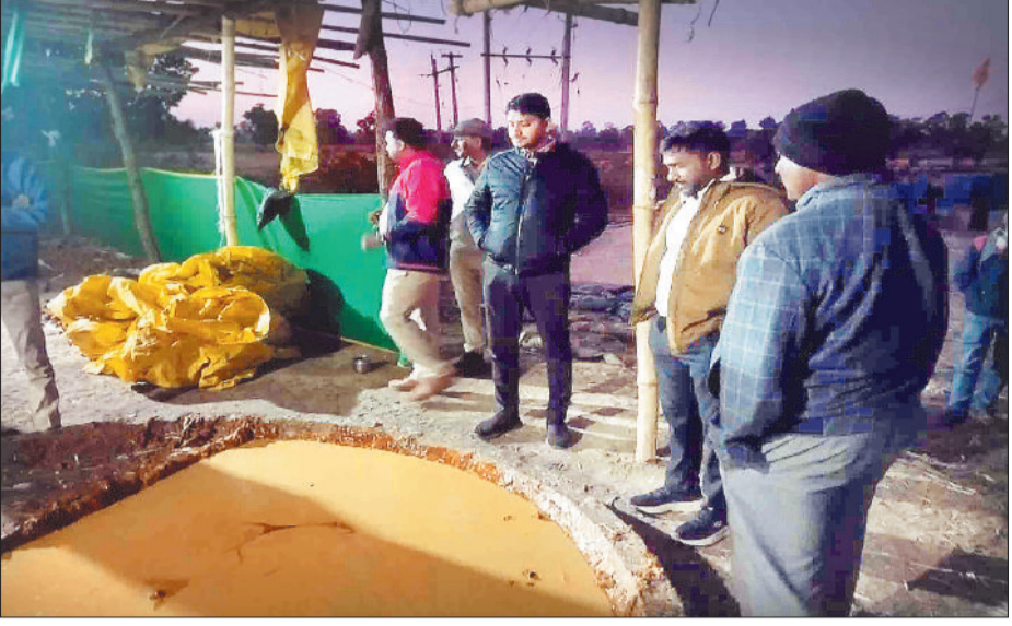
अवैध गुड़ फैक्ट्री का निरीक्षण करते अधिकारी।