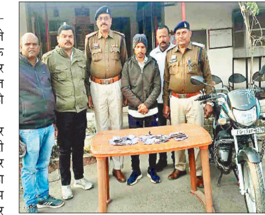
रखे रुपए व पासबुक को लेकर अचानक ही भाग निकला। रुपए लेकर भाग रहे आरोपी का ग्रामीण ने शोर मचाते हुए पीछा भी किया इसी दौरान ग्रामीण के पड़ोसी ने बाइक से पीछा कर

बैंक से घर लौट रहे ग्रामीण से 30 हजार रुपए की लूट के मामले में पुलिस को सफलता मिली है। पुलिस ने इस मामले में एक आरोपी को गिरफ्तार करने के साथ ही लूट की रकम 24 हजार रुपए भी बरामद किया है। आरोपी ने अपने मकान निर्माण सहित अन्य कार्यों से हुए कर्ज को पटाने के लिए लूट की वारदात को अंजाम दिया था।